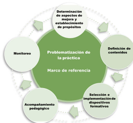
Figura 1.1 Componentes de la intervención formativa.

Las intervenciones formativas se integran por seis componentes (figura 1.1), que tienen como eje la problematización de la práctica, lo que en el caso específico de esta intervención formativa emergente (IF), permite identificar las problemáticas que los docentes de preescolar, primaria y telesecundaria experimentan cuando enfrentan el reto de incorporar en su trabajo cotidiano los planteamientos de una nueva propuesta curricular. Esto ayuda a determinar los aspectos que es posible mejorar y los propósitos que se espera alcancen al participar en esta IF y, posteriormente, definir los contenidos y seleccionar los dispositivos formativos, diseñar los recursos y materiales para uso de los participantes durante la implementación, así como los mecanismos de acompañamiento pedagógico y monitoreo.