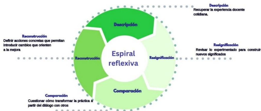
Figura 1.5 Referentes para pensar y movilizar la práctica docente