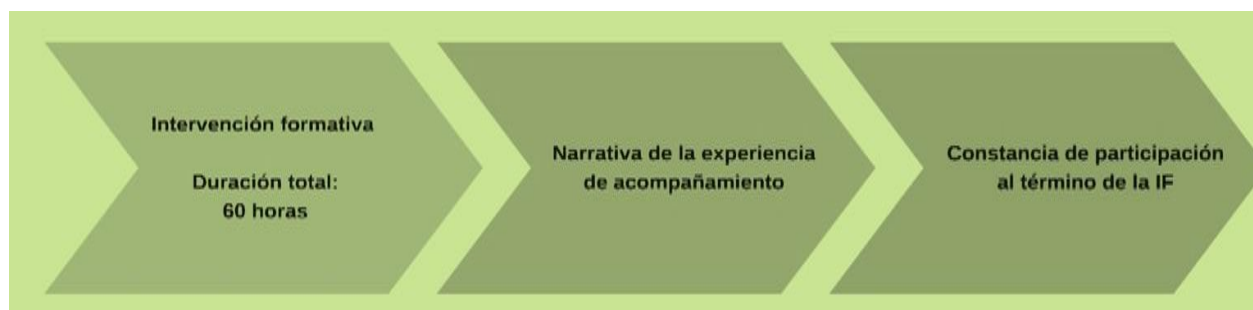
Figura 2.1 Elementos para documentar el proceso formativo del CDD