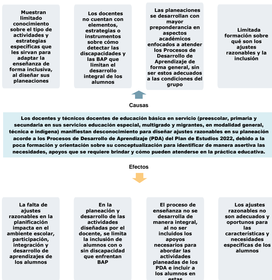
Figura 1.3 Identificación de causas y efectos respecto a la situación problemática